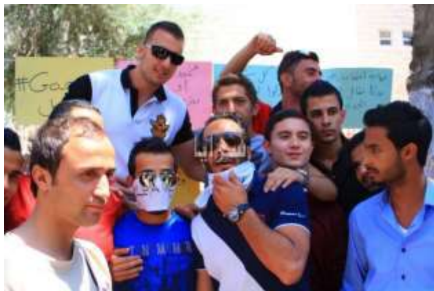
تجمع اعتراضی دانشجویان، دانشکده

اثری هم نمی‌توانند بگذارند. از نظر او، خدمتی که حکومت خودگردان به اشغالگران کرده خود آنان نکردند، و معتقد بود باید سران آن تغییر کنند، اردن هم همانگونه که پادشاه گفته باید نیمه‌پر لیوان را ببیند و طبق مصلحت همه عمل کند. معتقد بود ما باید کار دیپلماتیک خود را بر ضد آن بکنیم، ولی خب بخاری از فعالیت‌های دیپلماتیک بلند نمی‌شود. با وجود این اعتراف، حرفی از مقاومت نزد.