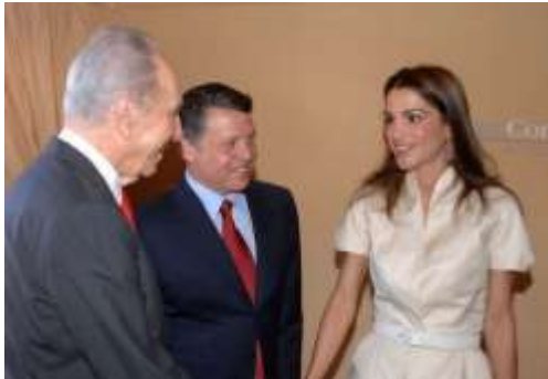
نیدار ملک عبدالله و همسرش با شیمون پرز رئیس وقت رژیم صهیونیستی

ملک عبدالله دوم پادشاه اردن، زاده مادرست انگلیسی، و البته پدری به ظاهر عرب! ملک حسین پدر وی، پادشاهی