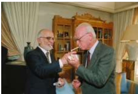
ملک حسین در حال روشن کردن سیگار اسحاق رابین نخست‌وزیر وقت رژیم صهیونیستی

همکاری مرکز با بنیاد فریدریش ایبرت ژرف‌تر از فعالیت‌های مشترک است. ابورمان از افراد کلیدی مرکز بررسی‌های